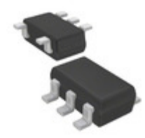
AD8638ARJZ-REEL7 Analog Devices Inc. IC OPAMP AUTO-ZERO 1.5MHZ SOT23-5