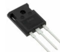
IXFH20N80Q IXYS MOSFET N-CH 800V 20A TO-247AD