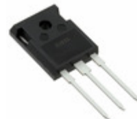
IXFH20N100P IXYS MOSFET N-CH 1000V 20A TO-247