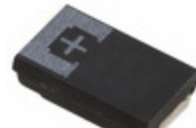
6TPE470MI Panasonic Electronic Components CAP TANT POLY 470UF 6.3V 2917