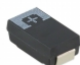
6TPE330ML Panasonic Electronic Components CAP TANT POLY 330UF 6.3V 2917