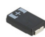
6TPF220M5L Panasonic Electronic Components CAP TANT POLY 220UF 6.3V 2917