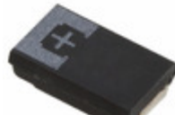
6TPE680M Panasonic Electronic Components CAP TANT POLY 680UF 6.3V 2917