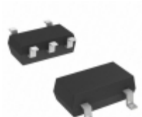
AT24C32D-STUM-T Microchip Technology IC EEPROM 32KBIT 1MHZ SOT23-5