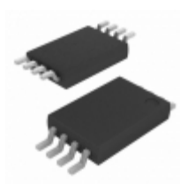
AT24C32D-XHM-T Microchip Technology IC EEPROM 32KBIT 1MHZ 8TSSOP