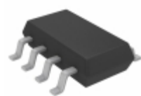
LTC2632CTS8-LX8#TRMPBF Linear Technology IC DAC 8BIT SPI/SRL TSOT-23-8