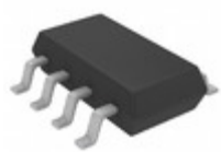
LTC2632CTS8-LX12#TRPBF ADI (Analog Devices, Inc.) IC DAC 12BIT SPI/SRL TSOT-23-8