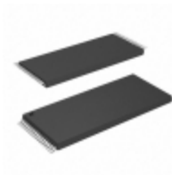
AT28C010-12TA Microchip Technology IC EEPROM 1MBIT 120NS 32TSOP