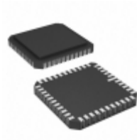
AT28C010-12LM/883 Micrel / Microchip Technology IC EEPROM 1MBIT 120NS 44CLCC