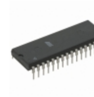
AT28C010-12PU Microchip Technology IC EEPROM 1MBIT 120NS 32DIP