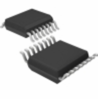
ADN4665ARUZ Analog Devices Inc. IC DRIVER DIFF LVDS QUAD 16TSSOP