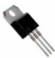
BUL7216 STMicroelectronics TRANS NPN 700V 3A TO-220