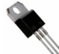
BUL704 STMicroelectronics TRANS NPN 400V 4A TO-220