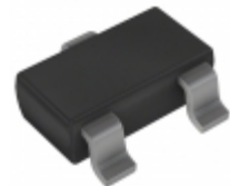
DDTC124TCA-7 Diodes Incorporated TRANS PREBIAS NPN 200MW SOT23-3