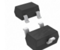
DDTC124TUA-7-F Diodes Incorporated TRANS PREBIAS NPN 200MW SOT323