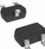
DDTC124TEQ-7-F Diodes Incorporated TRANS PREBIAS NPN 150MW SOT523