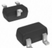
DDTC124XE-7 Diodes Incorporated TRANS PREBIAS NPN 150MW SOT523