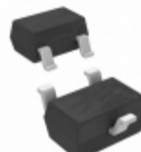
DDTC124TUA-7 Diodes Incorporated TRANS PREBIAS NPN 200MW SOT323