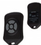
OTX-433-HH-KF5-DS Linx Technologies Inc. XMITTER KEYFOB 433MHZ 5 BUTTON