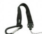
OTX-ACC-LSH-8.5 Linx Technologies LEASH FOR OEM TRANSMITTER