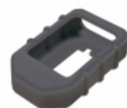
OTX-ACC-KIT-HH-OEM-B Linx Technologies COVER FOR OEM TX BLACK