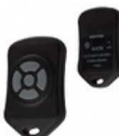
OTX-433-HH-KF5-MS Linx Technologies Inc. XMITTER KEYFOB 433MHZ 5 BUTTON