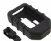
OTX-ACC-KIT-HH-BLK Linx Technologies COVER FOR OEM TX BLACK