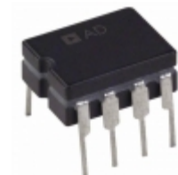
AD843BQ Analog Devices Inc. IC OPAMP GP 34MHZ 8CDIP