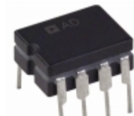
AD843AQ Analog Devices Inc. IC OPAMP GP 34MHZ 8CDIP