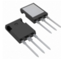
IXTR140P10T IXYS MOSFET P-CH 100V 90A ISOPLUS247