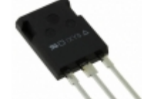
IXTR200N10P IXYS MOSFET N-CH 100V 120A ISOPLUS247