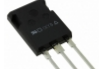
IXTR16P60P IXYS MOSFET P-CH 600V 10A ISOPLUS247