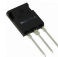
IXTR20P50P IXYS MOSFET P-CH 500V 13A ISOPLUS247