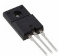
FML-23S Sanken DIODE ARRAY GP 300V 10A TO220F