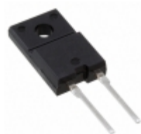
FML-G12S Sanken DIODE GEN PURP 200V 5A TO220F-2L