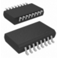
ADM2687EBRIZ Analog Devices Inc. OPTOISO 5KV TRANSCEIVER 16SOIC