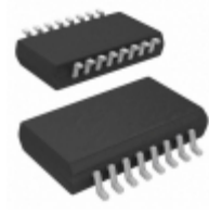
ADM2682EBRIZ Analog Devices Inc. OPTOISO 5KV TRANSCEIVER 16SOIC