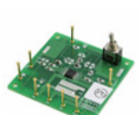
LV8804FVGEVB AMI Semiconductor / ON Semiconductor BOARD EVAL FOR LV8804FV