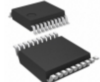
LV8804FV-MPB-H ON Semiconductor IC MOTOR DRIVER PWM 20SSOP