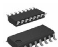
LV8800V-TLM-E ON Semiconductor IC MOTOR DRIVER PWM SSOP16