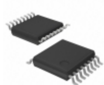
LV8800V-MPB-H ON Semiconductor IC MOTOR DRIVER PWM SSOP16