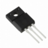
2SB0953AQ Panasonic Electronic Components TRANS PNP 40V 7A TO-220F