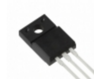
2SB09510P Panasonic Electronic Components TRANS PNP DARL 60V 8A TO-220F