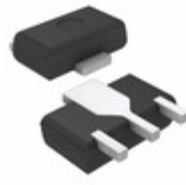
2SB09560RL Panasonic Electronic Components TRANS PNP 20V 1A MINI-PWR