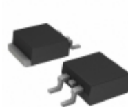
2SB09680RL Panasonic Electronic Components TRANS PNP 40V 1.5A U-G2