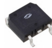
APT22F80S Microsemi Corporation MOSFET N-CH 800V 22A D3PAK