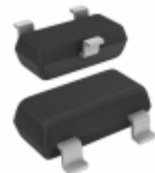
BCW32,215 Nexperia USA Inc. TRANS NPN 32V 0.1A SOT23