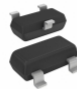
BCW31,215 Nexperia USA Inc. TRANS NPN 32V 0.1A SOT23