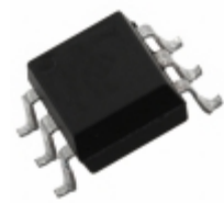
CNY17F-4S1(TB)-V Everlight Electronics Co Ltd OPTOISOLTR 5KV TRANSISTOR 6-SMD