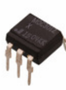
CNY17F-4X Isocom Components 2004 LTD OPTOISO 5.3KV TRANSISTOR 6DIP