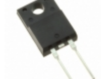
SDURF560 SMC Diode Solutions DIODE GEN PURP 600V ITO220AC