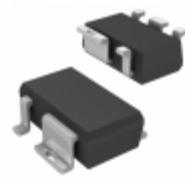
TLE42502GHTSA1 Infineon Technologies IC REG LDO ADJ 50MA SCT595