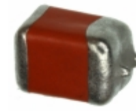
13008-073KESA Electro-Films (EFI) / Vishay CAP TANT 33UF 50V 10% 2917