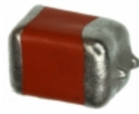
13008-073KESZ Electro-Films (EFI) / Vishay CAP TANT 33UF 50V 10% 2917