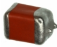
13008-073MESA Vishay Sprague CAP TANT 33UF 50V 20% 2917