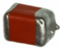
13008-073KESA/HR Electro-Films (EFI) / Vishay CAP TANT 33UF 50V 10% 2917