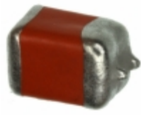
13008-073KESZ/HR Vishay Sprague CAP TANT 33UF 50V 10% 2917