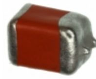
13008-073KESZ Vishay Sprague CAP TANT 33UF 50V 10% 2917