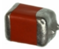
13008-073MESA Electro-Films (EFI) / Vishay CAP TANT 33UF 50V 20% 2917