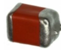
13008-073MESA/HR Electro-Films (EFI) / Vishay CAP TANT 33UF 50V 20% 2917