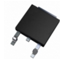
DSEP6-06BS IXYS DIODE GEN PURP 600V 6A TO252AA