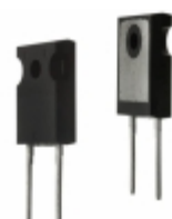
DSEP60-12A IXYS DIODE GEN PURP 1.2KV 60A TO247AD