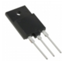
DSEP60-03A IXYS DIODE GEN PURP 300V 60A TO247