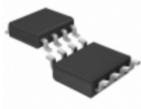
LTC1865IS8#TRPBF Linear Technology IC A/D CONV 2CH 16BIT 8-SOIC