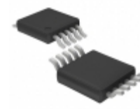
LTC1865LACMS#PBF Linear Technology IC ADC 2CH 16BIT 150KSPS 10MSOP