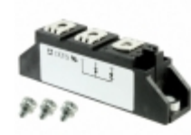
MDA72-16N1B IXYS DIODE MODULE 1.6KV 113A TO240AA