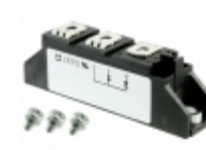
MDA72-14N1B IXYS DIODE MODULE 1.4KV 113A TO240AA