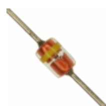
MTZJT-722.7B Rohm Semiconductor DIODE ZENER 2.7V 500MW DO34