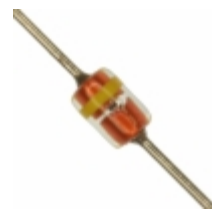
MTZJT-722.0B Rohm Semiconductor DIODE ZENER 2V 500MW DO34