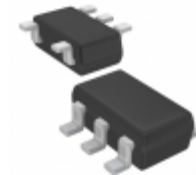
XC6122C438MR-G Torex Semiconductor Ltd IC WATCHDOG TIMER SOT-25