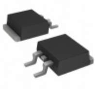
C3D06060G-TR Cree/Wolfspeed DIODE SCHOTTKY 600V 6A TO263-2