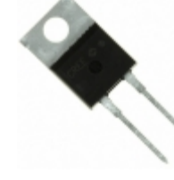
C3D06065I Cree/Wolfspeed DIODE SCHOTTKY 650V 13A TO220-2