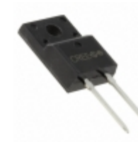
C3D06060F Cree/Wolfspeed DIODE SCHOTTKY 600V 6A TO220-F2