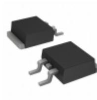
C3D06060G-TR Cree Wolfspeed DIODE SCHOTTKY 600V 6A TO263-2