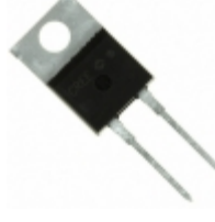
C3D06065I Cree Wolfspeed DIODE SCHOTTKY 650V 13A TO220-2