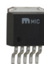
MIC39301-1.8WU Microchip Technology IC REG LDO 1.8V 3A TO263-5