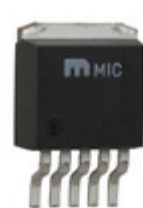
MIC39301-1.8BU Microchip Technology IC REG LDO 1.8V 3A TO263-5