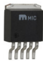
MIC39301-1.65BU Microchip Technology IC REG LDO 1.65V 3A TO263-5