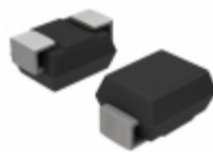
SZP6SMB12AT3G Littelfuse Inc. TVS DIODE 10.2VWM 16.7VC SMB2