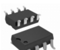
HCPL-3760-300E Broadcom Limited OPTOISOLATOR 3.75KV DARL 8DIP GW