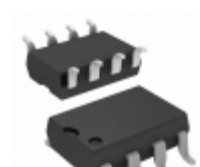
HCPL-4100#300 Broadcom Limited OPTOISO 3.75KV TRNSMTR 8DIP GW