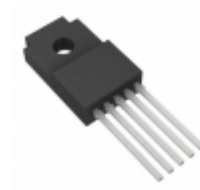
BAJ2CC0WT LAPIS Semiconductor IC REG LDO 12V 1A TO220FP-5