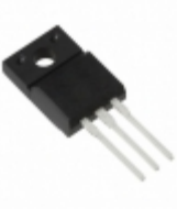
BAJ5CC0T LAPIS Semiconductor IC REG LDO 15V 1A TO220FP