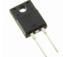
SDURF1020 SMC Diode Solutions DIODE GEN PURP 200V ITO220AC