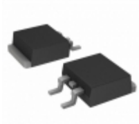
SDURD520TR SMC Diode Solutions DIODE GEN PURP 200V DPAK