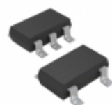
ADP2108AUJZ-2.3-R7 Analog Devices Inc. IC REG BCK 2.3V 0.6A SYNC TSOT23