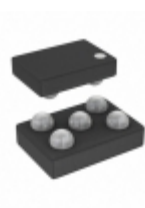
ADP2109ACBZ-1.2-R7 Analog Devices Inc. IC REG BCK 1.2V 0.6A SYNC 5WLCSP