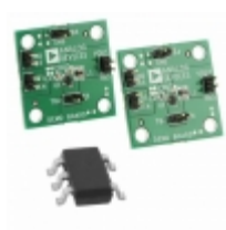
ADP2108UJZ-REDYKIT ADI (Analog Devices, Inc.) KIT REDY TOOL 1.2/3.3 ADP2108