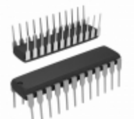
ATF22LV10C-15PC Microchip Technology IC PLD 10MC 15NS 24DIP