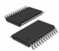
ATF22LV10C-10XU Microchip Technology IC PLD 10MC 10NS 24TSSOP