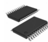
ATF22LV10C-10XC Microchip Technology IC PLD 10MC 10NS 24TSSOP