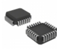
ATF22LV10C-15JI Microchip Technology IC PLD 10MC 15NS 28PLCC