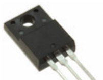
SDURF2020CTR SMC Diode Solutions DIODE ARRAY GP 200V ITO220AB