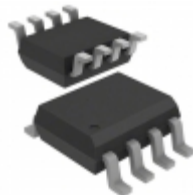
AD8429ARZ-R7 Analog Devices Inc. IC OPAMP INSTR 15MHZ 8SOIC