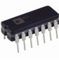
AD842JQ Analog Devices Inc. IC OPAMP GP 80MHZ 14CDIP