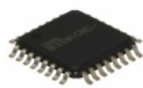
SY89296UTI Microchip Technology IC DELAY LN 1024TAP PROG 32TQFP