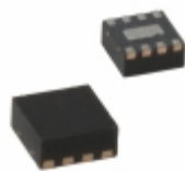
SY89306VMI TR Microchip Technology IC DELAY LINE 2.5V/3.3V 8MLF