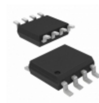
AD633TRZ-EP ADI (Analog Devices, Inc.) BIPOLAR MULTIPLIER 4QUAD