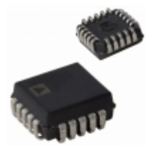
AD7224KPZ Analog Devices Inc. IC DAC 8BIT W/OUTPUT AMPS 20PLCC