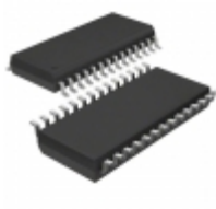
ADM211ARS Analog Devices Inc. IC TX/RX RS-232 5V 0.1UF 28SSOP