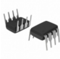
ADM698AN Analog Devices Inc. IC SUPERVISOR MPU 4.65V 8DIP