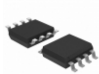
MCP4821T-E/SNVAO Micrel / Microchip Technology IC DAC 12BIT W/SPI 8SOIC