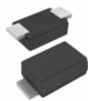
BZD27C18P-HE3-08 Vishay Semiconductor Diodes Division DIODE ZENER 800MW SMF DO219