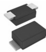
BZD27C18P-HE3-18 Electro-Films (EFI) / Vishay DIODE ZENER 800MW SMF DO219