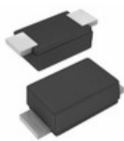
BZD27C18P-M3-18 Electro-Films (EFI) / Vishay DIODE ZENER 800MW SMF DO219-M3