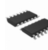
74ALVC38MX Fairchild/ON Semiconductor IC GATE NAND 4CH 2-INP 14-SOIC