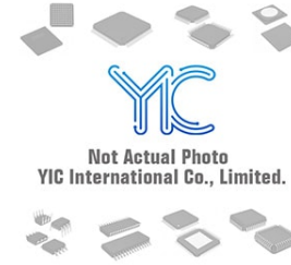
RF3855TR13 RFMD RFMD LGA