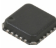
RF3865TR7 RFMD IC AMP LOW-NOISE 2-STAGE 20-QFN