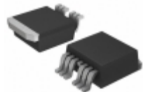
IXTA180N085T7 IXYS MOSFET N-CH 85V 180A TO-263-7