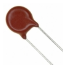
V39ZA3 Littelfuse Inc. VARISTOR 39V 500A DISC 10MM