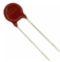
V39ZA3P Littelfuse Inc. VARISTOR 39V 500A DISC 10MM