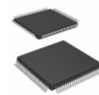
TW8834AT-TA2-GR Intersil IC LCD PROCESSOR 100TQFP