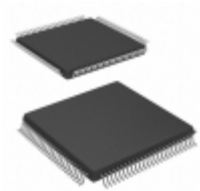
TW8834-TA2-CR Intersil IC LCD PROCESSOR 100TQFP