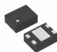
XC6118N20DGR-G Torex Semiconductor Ltd IC SUPERVISOR 2.0V 4-USP